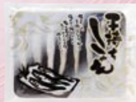
子持ちししゃも2L 8尾