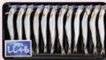
子持ちししゃも3L 12尾