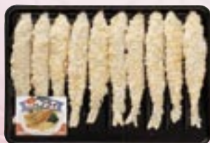
ししゃもフライ 10尾