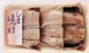
しまほっけ開き 3尾