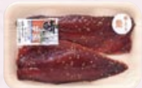
さばみりん骨取 2枚